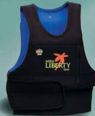
WJW ウェストハーネス用 FOR WAIST HARNESS

世界中のスピードチャレンジに使用されるリバティウェイトジャケット。リバティブランドのスタートがここにある。