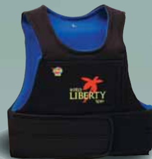
WJ シートハーネス用 FOR SEAT HARNESS